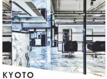
AIME byn AIME by noism

11のヘアサロン、アイラッシュ、ネイルサロンを展開。 20代~40代のご来店が多く、特に若いお客様に愛されています。